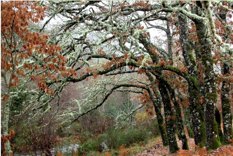
A Ribeira Grande . Reboleira.