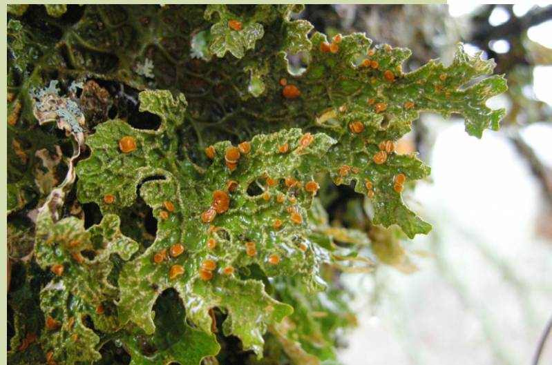
Lobaria pulmonaria . Un lique facilmente recoñecíbel polo seu gran tamaño que se atopa sobre os toros das árbores. As manchas vermellas son os corpos reprodutores.