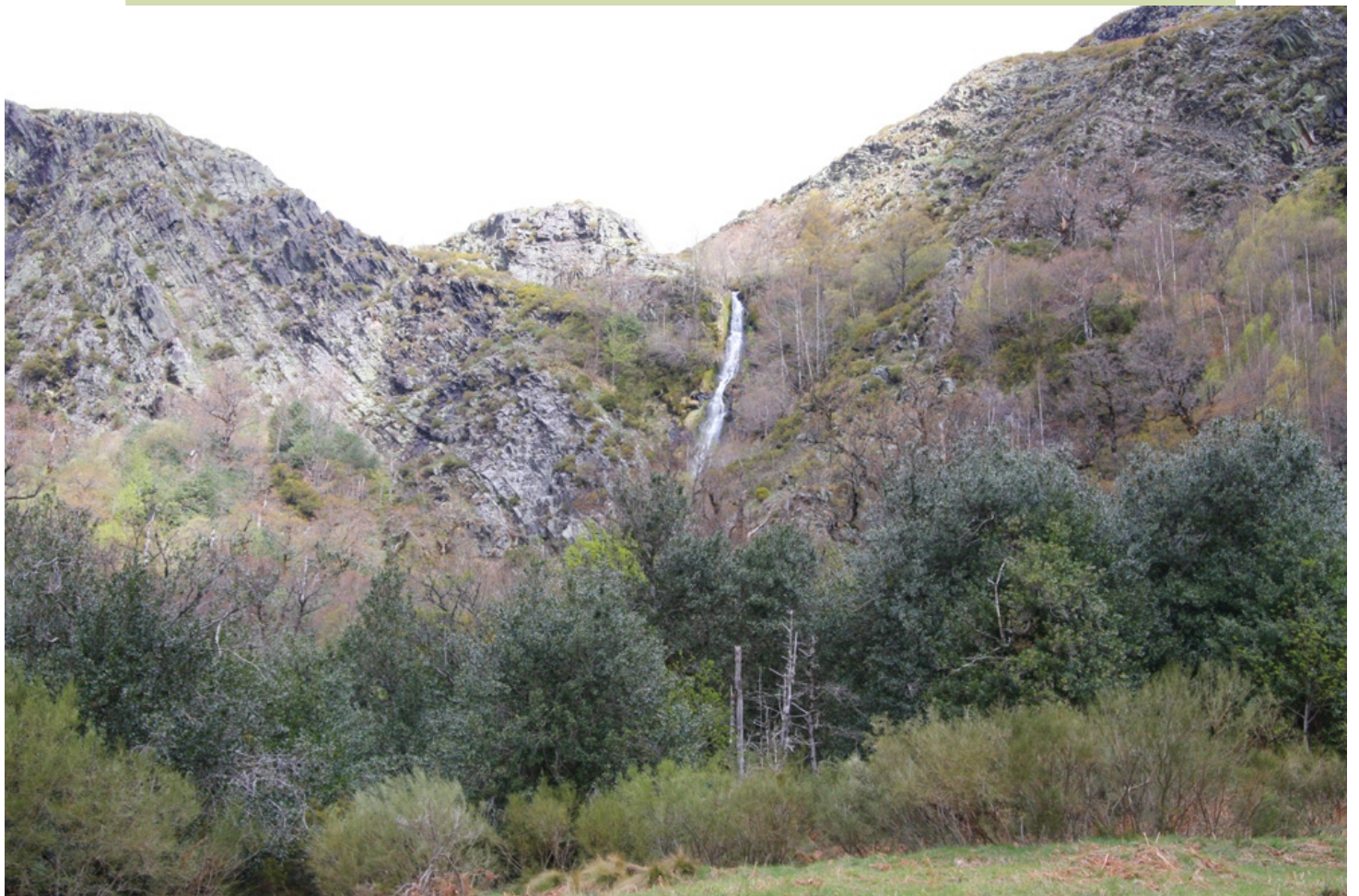
Vista do circo glaciar de Guasenza, coa fervenza de Arcos, no Figueiro, na zona da Reserva Integral.