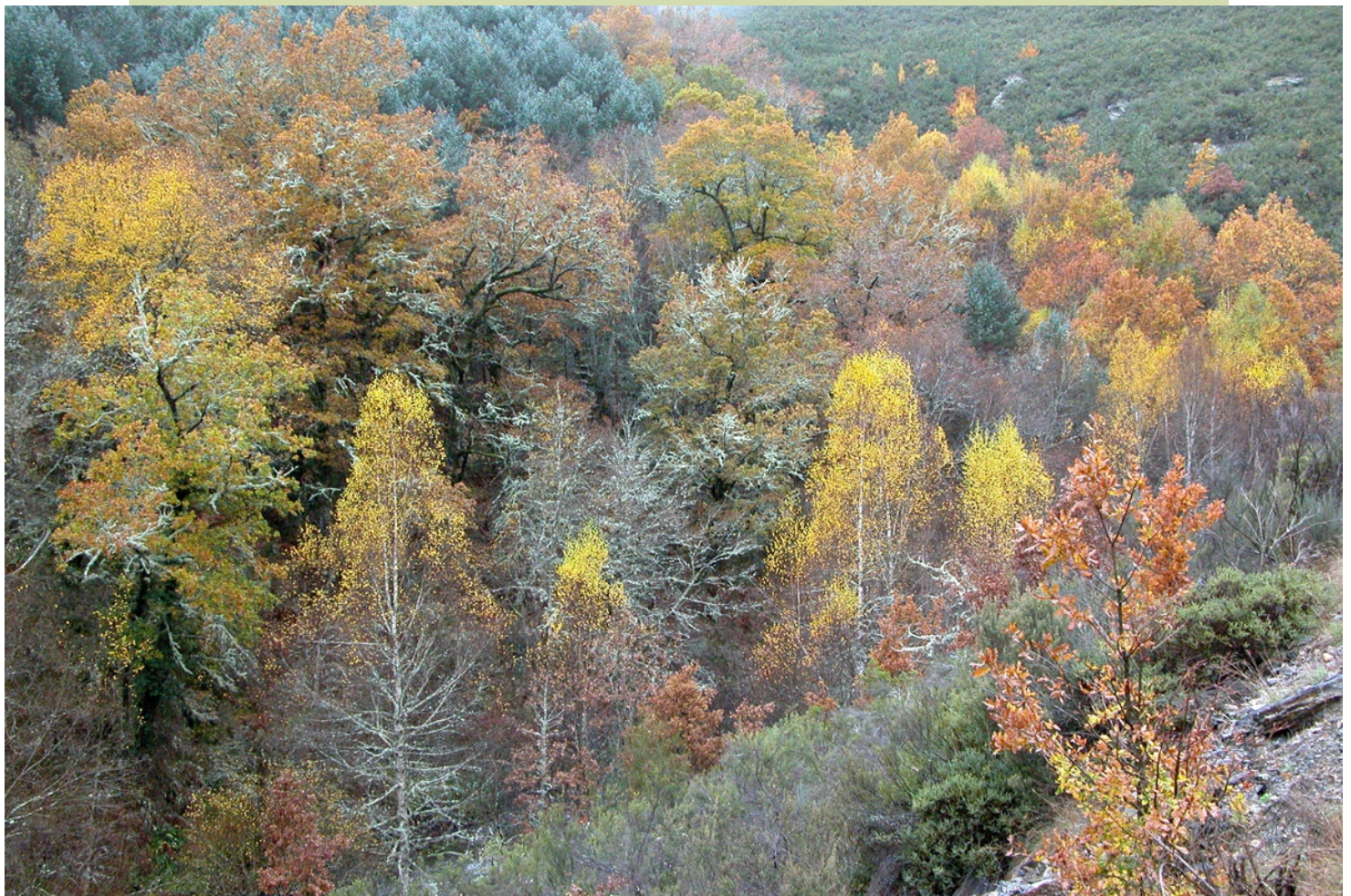
Bosque no outono, ao pé da Ribeira Pequena