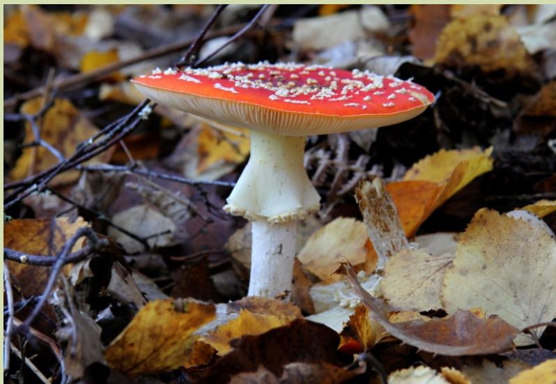
Rebentabois ( Amanita muscaria )

Cabra fera, reintroducida no parque, pódese ver ao lonxe coroando as zonas máis escarpadas.