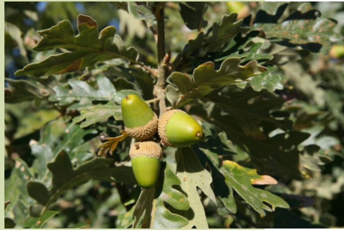
Landras de rebolo