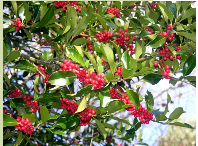
Froitos de acivro